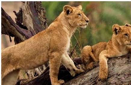
Parque Nacional del Serengueti