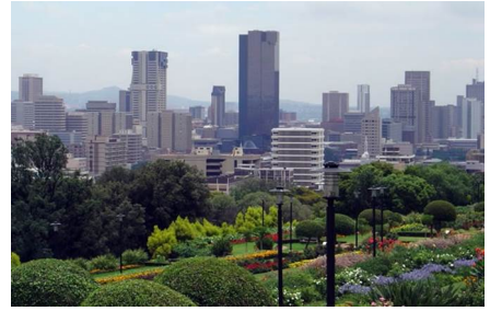
Ciudad del Cabo