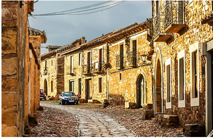
Villafranca Del Bierzo