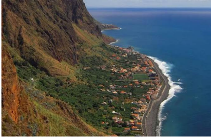
Faja da Ovelha