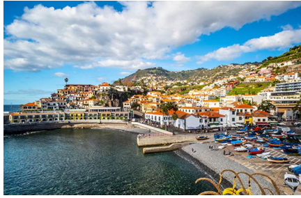
Câmara do Lobos