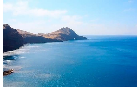
Ponta do sol / Ribeira Brava