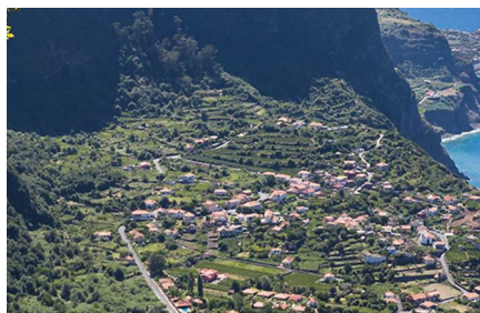
Arco de São Jorge