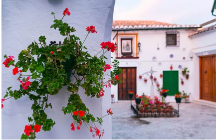
Priego De Córdoba