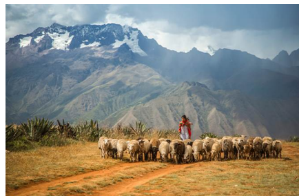
Valle Sagrado de los Incas