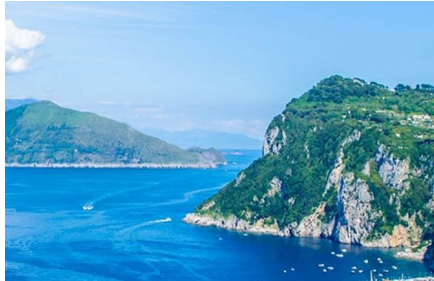
Isla de Capri