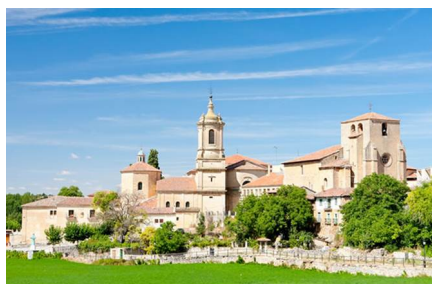
Santo Domingo De Silos