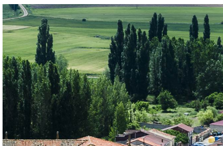
Peñaranda de Duero