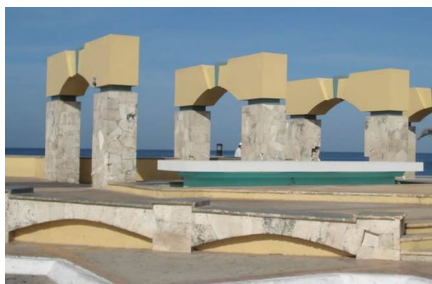
San Francisco de Campeche