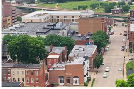
Dubuque - Ia