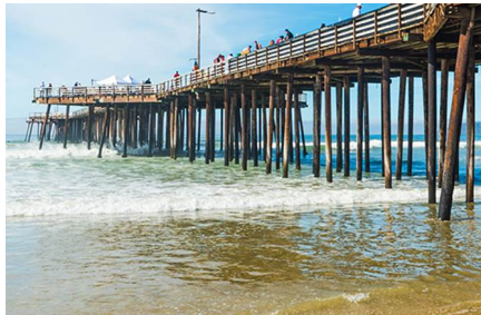
Pismo Beach - Ca