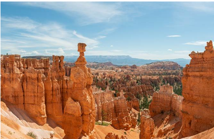
Parque Nacional del Cañón Bryce