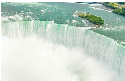
Cataratas Del Niágara