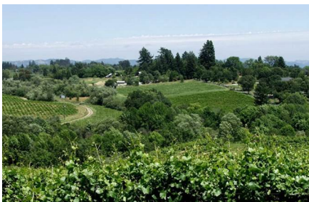
Sonoma - Ca