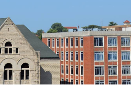
Sioux City - Ia