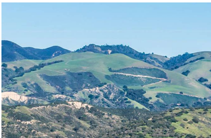
Carmel Valley - Ca