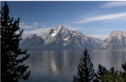
Teton Village - Wy