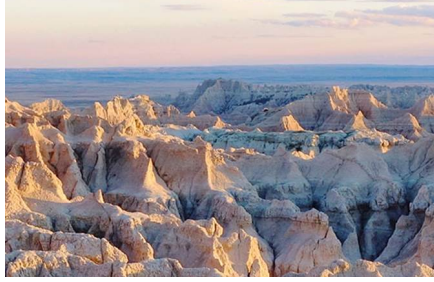
Parque Nacional Badlands - Sd