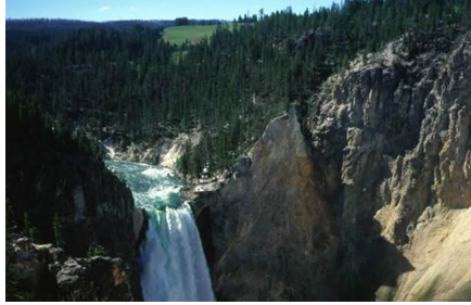
Yellowstone - Wy