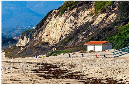
Malibu - Ca