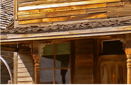
Cody - Wy