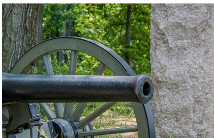
Gettysburg - Pa