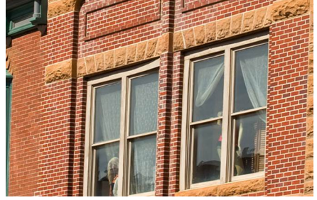
Deadwood - Sd