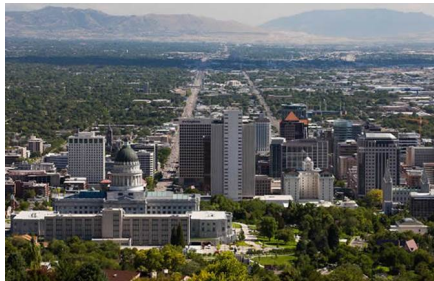
Salt Lake City - Ut