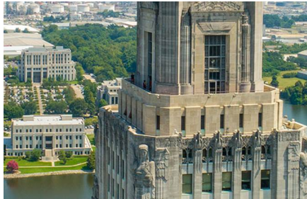
Baton Rouge - La