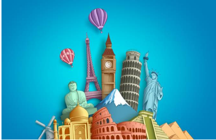
Vicksburg - Ms