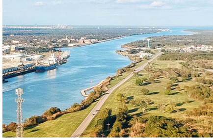
Port Arthur - Tx