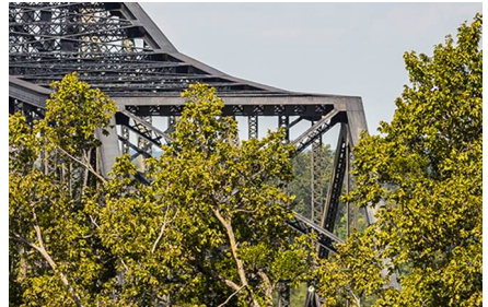
Natchez - La