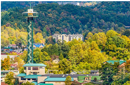
Gatlinburg - Tn