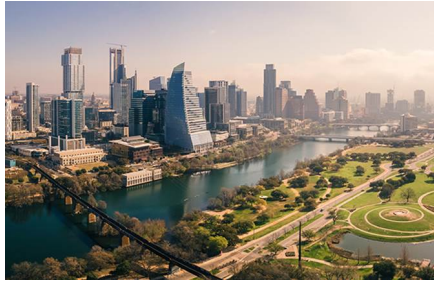
Austin - Tx