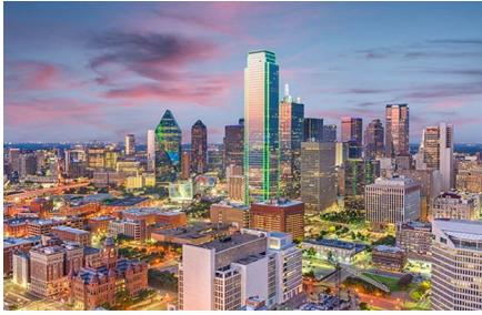
Dallas - Tx