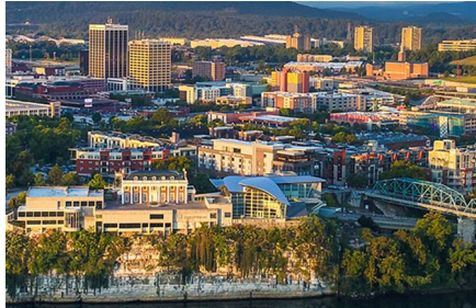
Chattanooga - Tn