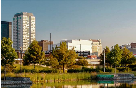
Birmingham - Al