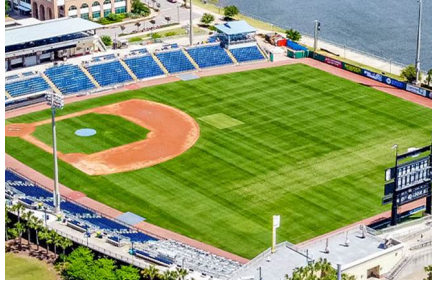
Pensacola - Fl