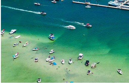
Orange Beach - Al