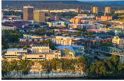
Chattanooga - Tn