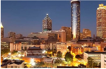
Atlanta - Ga