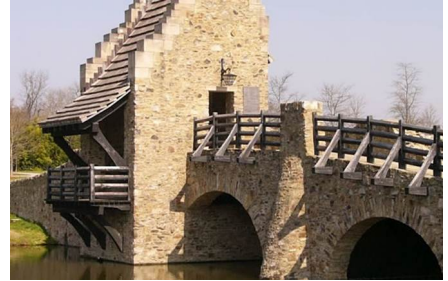
Montgomery - Al