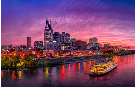
Nashville - Tn