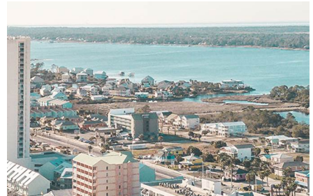
Gulf Shores - Al