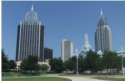
Mobile - Al