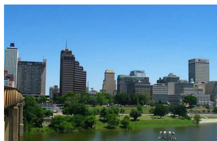
Memphis - Tn