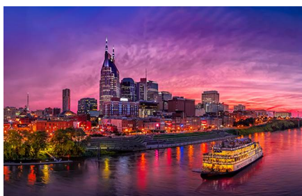
Nashville - Tn