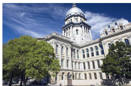
Springfield - Il