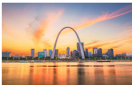
Saint Louis - Mo