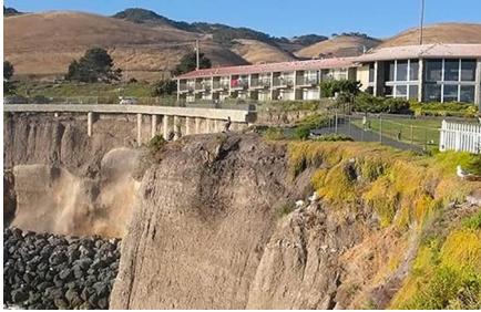
San Luis Obispo - Ca