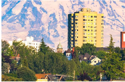
Tacoma - Wa