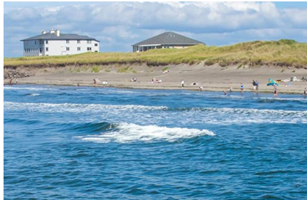
Ocean Shores - Wa