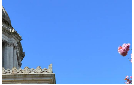
Olympia - Wa