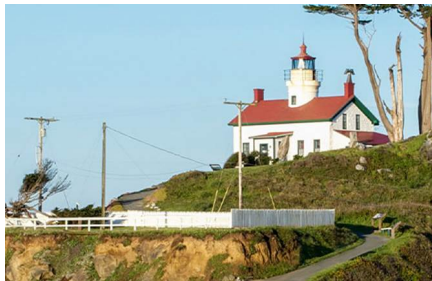
Crescent City - Ca