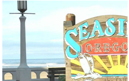
Seaside - Or