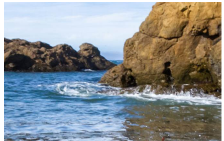
Fort Bragg - Ca