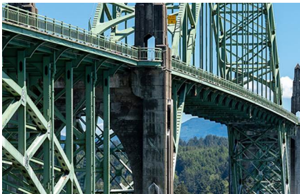
Newport - Or