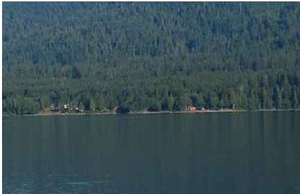
Quinault - Wa