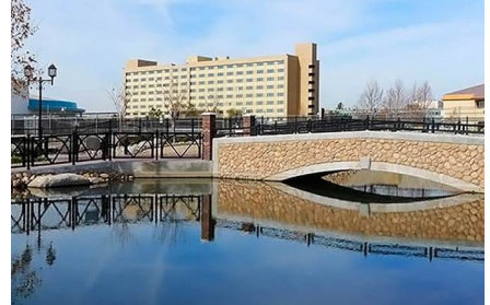
Bakersfield - Ca