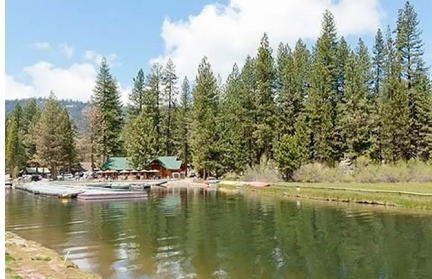
Fresno - Ca