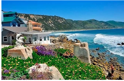
Santa Barbara - Ca