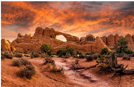
Moab - Ut