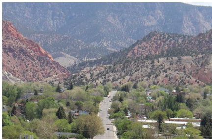
Cedar City - Ut