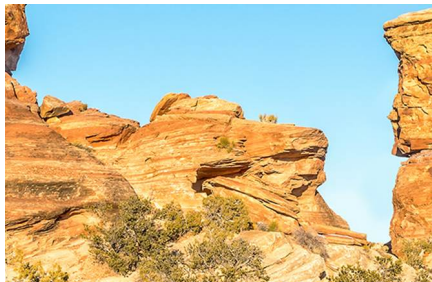
Monticello - Ut