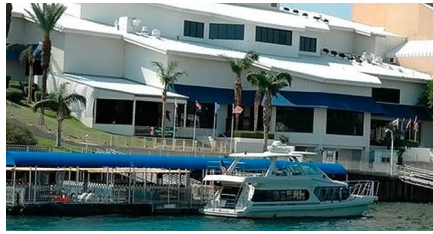
Williams - Az