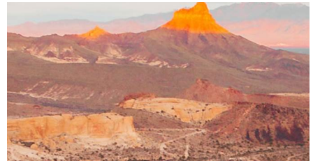
Flagstaff - Az