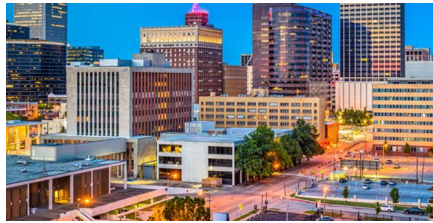
Lebanon - Mo