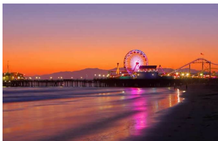
Santa Monica - Ca