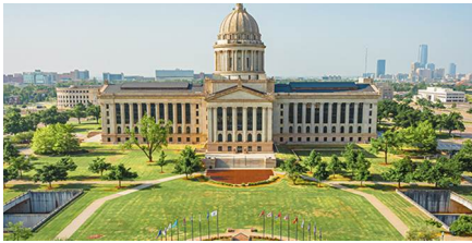
Springfield - Mo