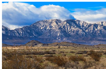
Victorville - Ca