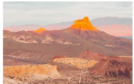
Victorville - Ca