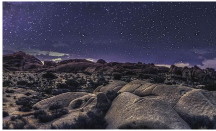
Prescott Valley - Az