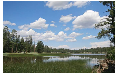
Kingman - Az