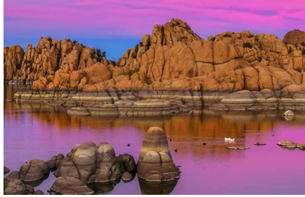
Gran Cañón - Az