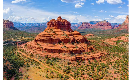
Williams - Az