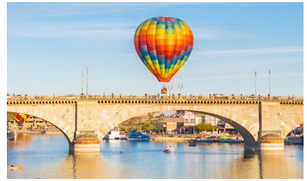
Sedona - Az