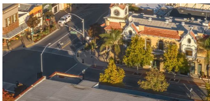
Gilroy - Ca