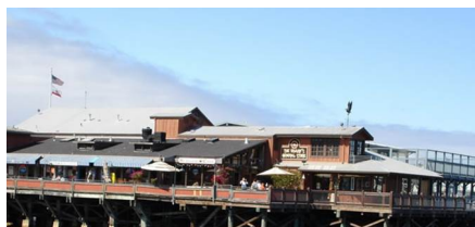
Monterey - Ca