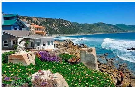
Santa Barbara - Ca