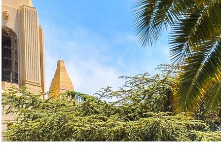
Point Reyes Station - Ca