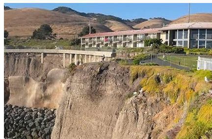
San Luis Obispo - Ca