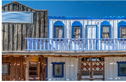
Page - Az