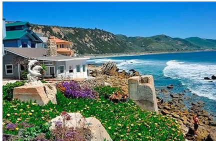
Santa Barbara - Ca