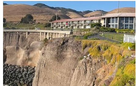
San Luis Obispo - Ca