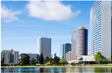
Oakland - Ca