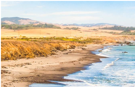
Carmel-by-the-Sea - Ca