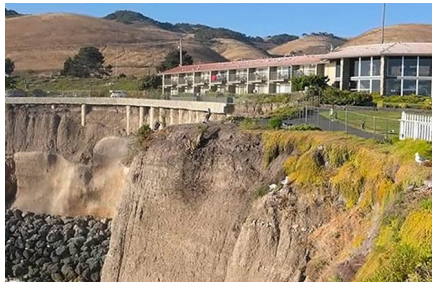
San Luis Obispo - Ca