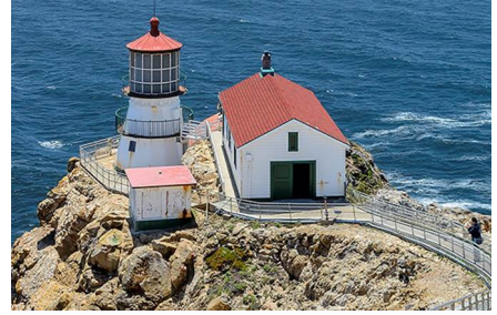
Point Reyes Station - Ca