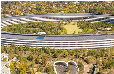
Cupertino - Ca