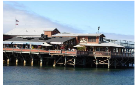
Monterey - Ca