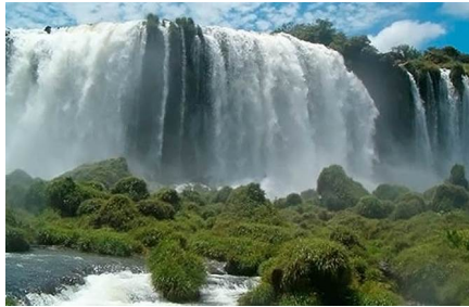
Cataratas Del Niágara