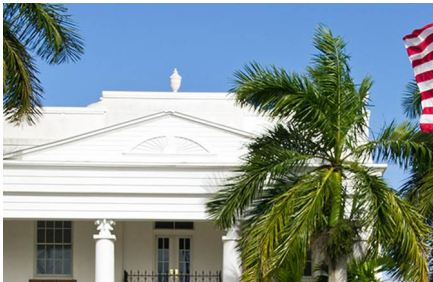
Everglades City - Fl