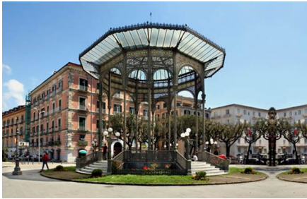
Castellammare di Stabia