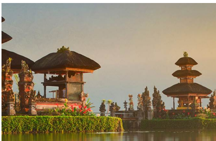
Isla de Bali