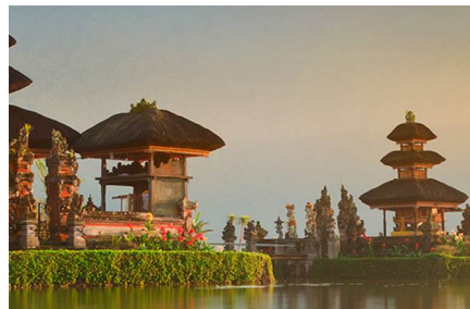
Isla de Bali