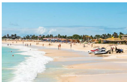
Isla de laSal