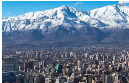
Santiago de Chile