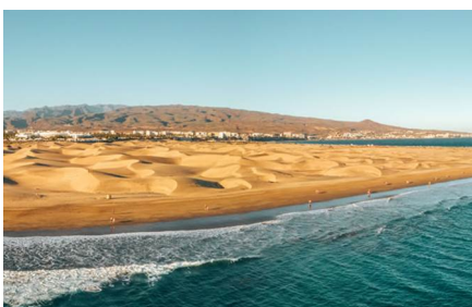
Isla de laSal