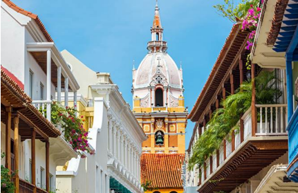
Cartagena De Indias