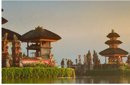
Isla de Bali