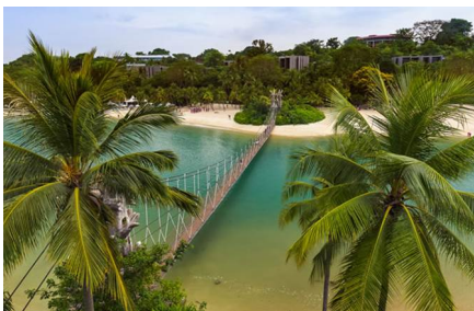
Isla de Singapur