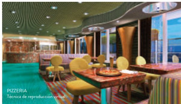
PIZZERIA Técnica de reproducción virtual

1862 camarotes, de los cuales: 130 con acceso directo al Spa, 756 con balcón privado, 64 suites, todas con balcón privado, 11 suites con acceso directo al Spa