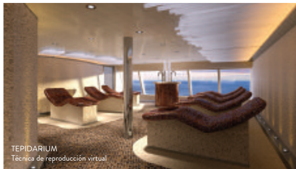
TEPIDARIUM Técnica de reproducción virtual